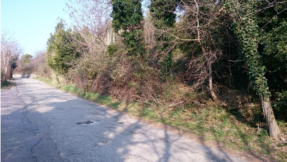
FOTO 7 – traccia di muro a secco che potrebbe rappresentare un tratto di confine con la p.c.n.3660