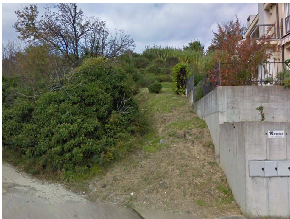
FOTO 4 – attacco del sentiero che parte da Rio Storto per accedere alla parte sud del lotto 1