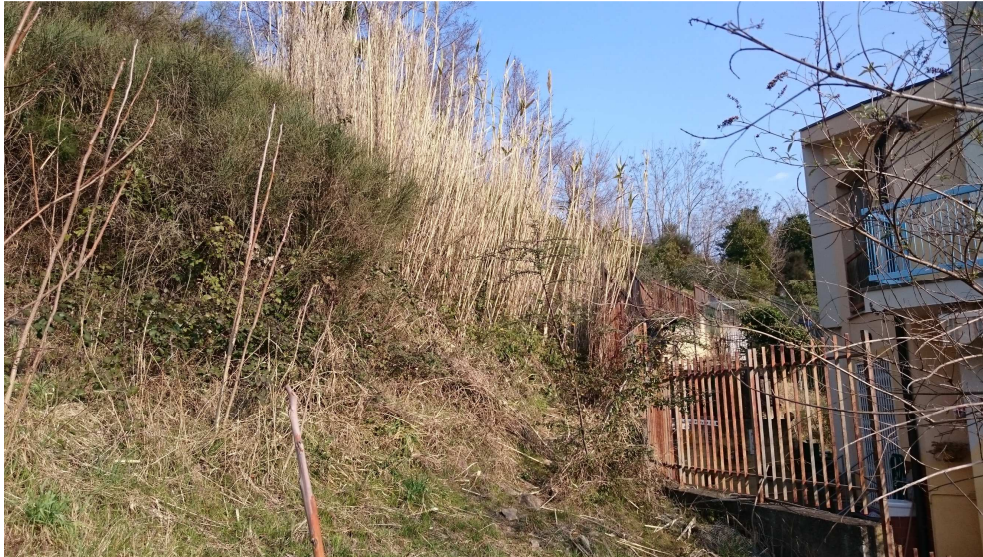
FOTO 5 – confine con i condomini eretti sulle pp.cc.nn. 755/10, 755/11, 755/12 e 755/13