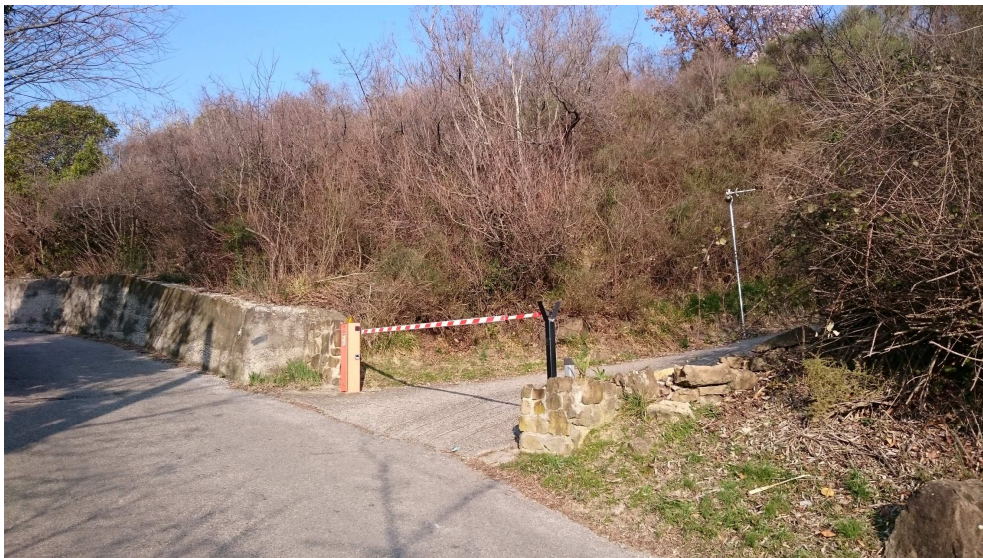
FOTO 6 – incrocio tra strada “ad uso pubblico” (tratto di via Pianezzi) e strada privata che attraversa la p.c.n.755/7